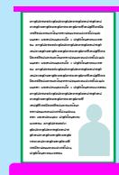
การโฆษณา