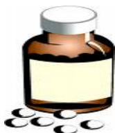
ยาแผนโบราณ